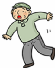
背中や腰の痛みのために 動作がぎこちない