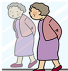
背中や腰が曲がったように感じる