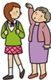
背が縮んだように感じる (実際腰が縮んだ)