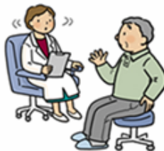
腰が痛いけど、レントゲン検査では 椎間板や脊柱管に異常がない